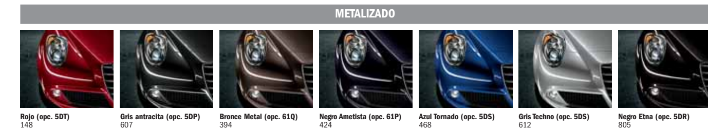
Rojo (opc. 5DT) 148