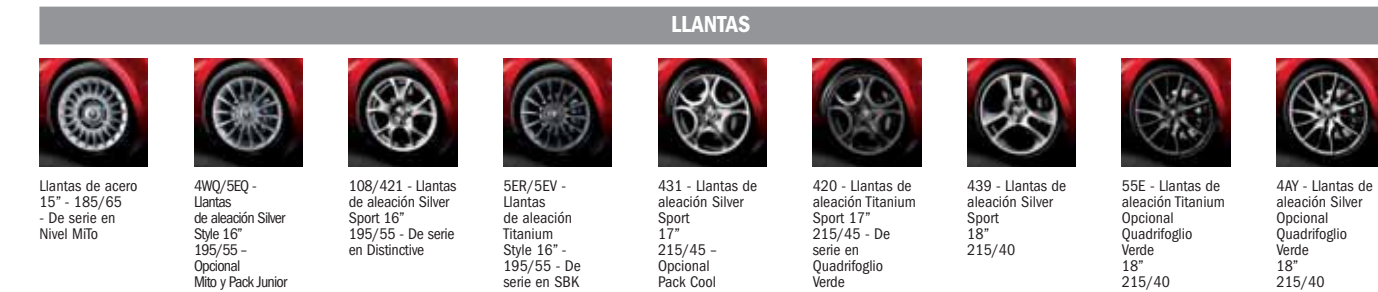
Llantas de acero 15" - 185/65 - De serie en Nivel MiTo