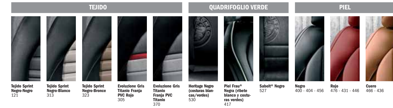
Tejido Sprint Negro-Negro 121