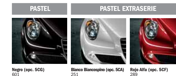
Negro (opc. 5CG) 601